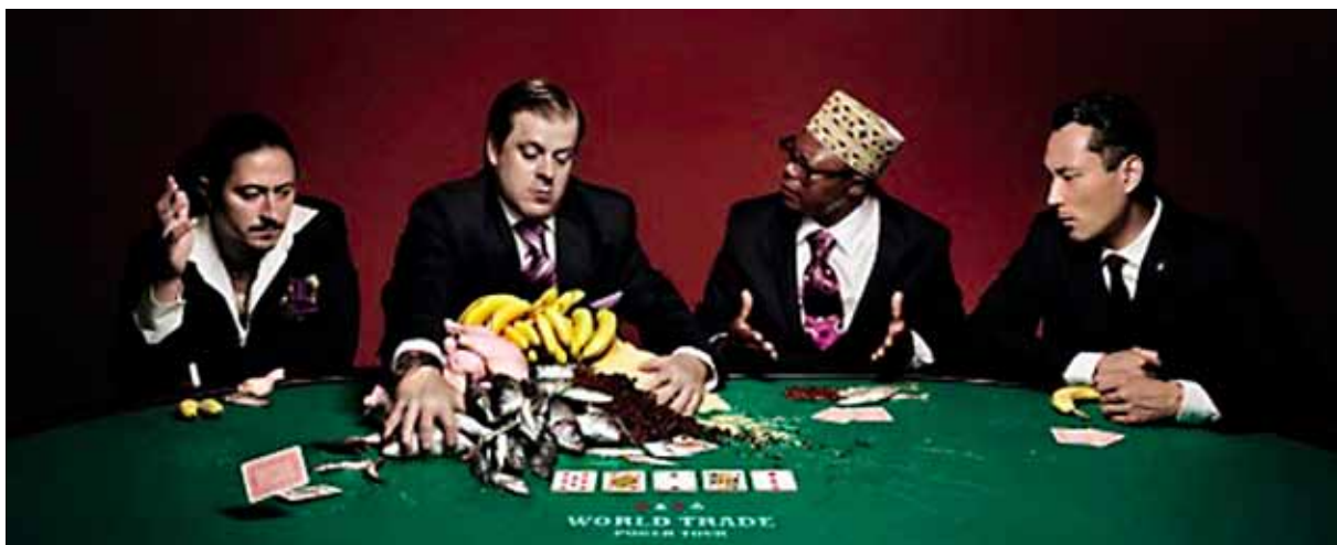
Nein, dies ist nicht das Gemeindekomitee Brot für alle der Ref. Kirchgemeinde, sondern ein Bild unfairen Handelns.

Wir wollen dazu beitragen, dass man sich dieser Zusammenhänge bewusst wird und entsprechend agiert. «Fair handeln» im doppelten Sinne, das ist auch unser Motto.