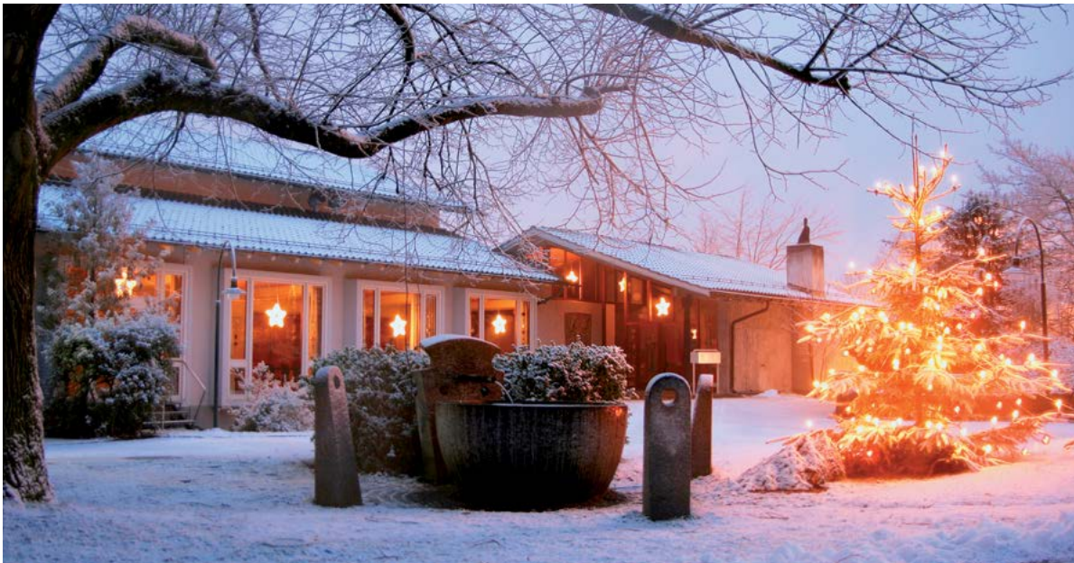
Heiligabend miteinander feiern – im Kirchgemeindehaus Witikon

Wir heissen Sie alle am Heiligabend herzlich willkommen! Familien, Jung und Alt, Freunde und Freundinnen, Seniorinnen