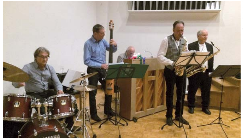
Die Band «Grooving Tuesday» erfreute die Gäste mit Jazzmusik

angekündigt. Bald schon zogen feine Gerüche durch den Saal, und eine schmackhafte kräftige Gemüsecremesuppe wurde aufgetragen, die sichtlich allen schmeckte, denn plötzlich wurde es ruhig, und nur noch das leise Geklapper der Suppenlöffel war zu hören. Den Hauptgang – Rataouille, Steinpilzrisotto, Kürbisrisotto und Hacktätschli – holte sich jeder Teilnehmer selber am Büffet im Foyer. Ein Festessen! Das abschliessende Dessertbüffet durfte da natürlich nicht fehlen. Die Magierköche von Beat Sutter hatten das reichhaltige und feine Menu gekocht, und ihre Arbeit wurde mit anhaltendem Applaus verdankt.