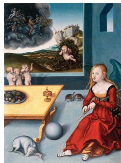
Lucas Cranach der Ältere: Melancholie (1532)