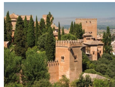
Weltkulturerbe Alhambra, Granada

Wie bereits angekündigt, führt die Gemeindestudienreise 2018 nach Südspanien. Sie findet statt 8.-16. September 2018 . Ihr Thema: «Andalusien: Juden, Moslems und Christen» . Genauere Angaben folgen demnächst.