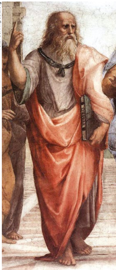
Platon – Detailsicht aus Raffaels «Die Schule von Athen» (1510-1511)