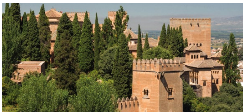
Weltkulturerbe Alhambra, Granada