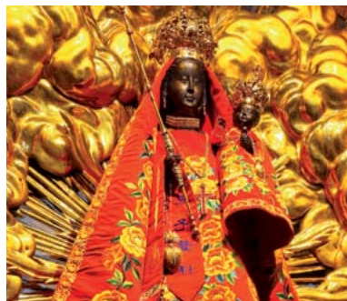
Schwarze Madonna von Einsiedeln

Die meisten Mariendarstellungen, die seit vielen Jahrhunderten als besondere «Gnadenbilder» verehrt werden, sind dunkel – so auch die Mariendarstellung von Einsiedeln. Warum? Der erste, der dies hinterfragte, war der bahnbrechende Seelenforscher C.G. Jung. Er entwickelte spannende Deutungen im Sinne der