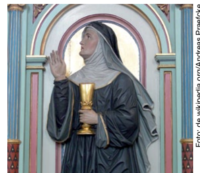
Mechthild von Magdeburg (Peter Paul Metz, Pfarrkirche Merazhofen)

Donnerstag, 1. Oktober 2020 9.00 Uhr, Ref. Kirchgemeindehaus Ökumenischer Frauentreff «Frauenmystik des 12. und 13. Jahrhunderts»