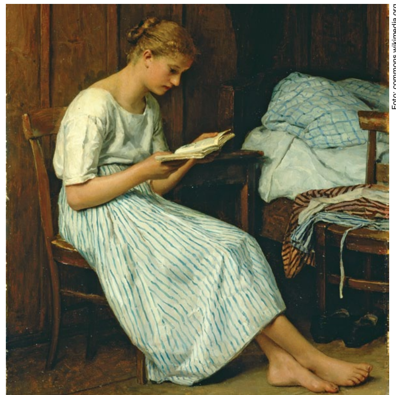
Albert Anker – Eine Gotthelf-Leserin