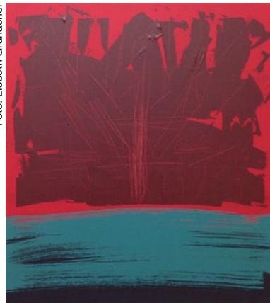
Bild aus der Serie Innenwelt / Der Messias / G.F. Händel, Acryl auf Baumwolle, 45 x 50 cm

sind ihre Bilder noch für eine Weile in der Neuen Kirche zu sehen. Anlass dafür ist der Gottesdienst am Sonntag, 15. November, 10.00 Uhr.