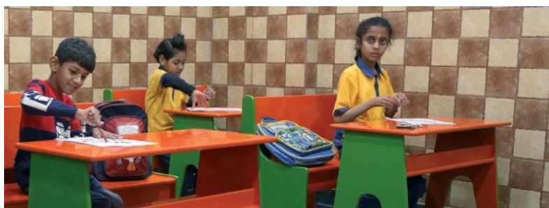
ASRA Stiftung Schweiz: Schule in Dehli

An einer Abendveranstaltung im HOCH3 stellen Projektverantwortliche ihre Organisation vor und geben Rechenschaft über ihre Tätigkeit und die gesteckten Ziele. Interessierte erhalten Einblick in Erfolge und Herausforderungen der aktuellen Arbeit sowie über die Verwendung der finanziellen Mittel. Die Anlässe werden kulinarisch umrahmt und bieten Gelegenheit für informellen Austausch und direkte Rückfragen an die Verantwortlichen. Ziel der Aktion «Charity» ist es, dank Solidarität, Information und Transparenz grosszügige Geldspenden zu sammeln, die den vorgestellten Projekten vollumfänglich zugutekommen. Die Aktion startet an viererst drei Samstagabenden.